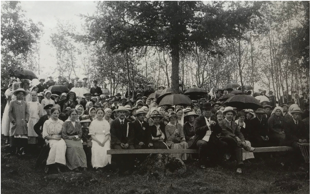
Laulujuhlayleisöä vuoden 1925 laulujuhlista sekä laululava vuoden 1915 kesäjuhlista.