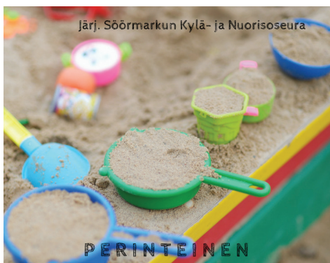
Järj. Söörmarkun Kylä- ja Nuorisoseura

Kesäkirppis toimii talon yläkerrassa ja kirpputoripöytä voi varata kesäduunareilta. Myyntiaika on kaksi viikkoa ja tänä aikana kesäduunarit huolehtivat pöytien siisteydestä sekä myynnistä. Halutessasi voit myös lahjoittaa tavaraa myytäväksi Kylä- ja Nuorisoseuran hyväksi.