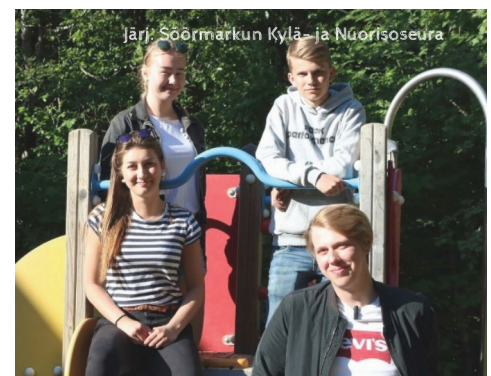
Järj. Söörmarkun Kylä- ja Nuorisoseura