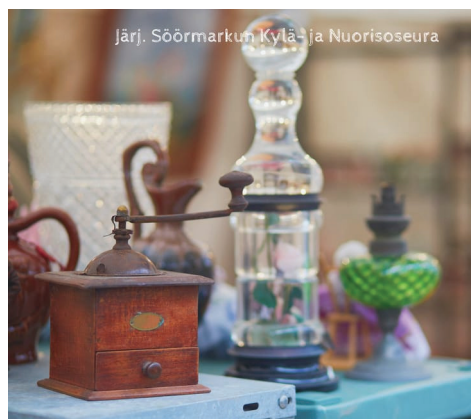
Järj. Söörmarkun Kylä- ja Nuorisoseura